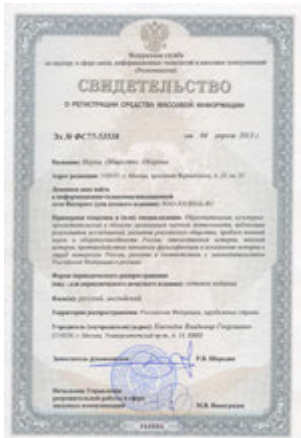
Свидетельство о регистрации