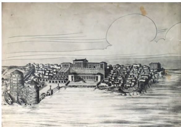
С. Ф. Стрежелецкий. «Реконструкция Херсонеса эллинистического времени. Вид с восточной стороны Карантинной бухты». Свердловск. 13 апреля 1942 г. Музей истории УрГПУ

S. F. Strzelecki. "Reconstruction of Chersonisos, Hellenistic Period. Quarantine Bay Side View" Sverdlovsk, 13 April, 1942. From Museum of History USPU