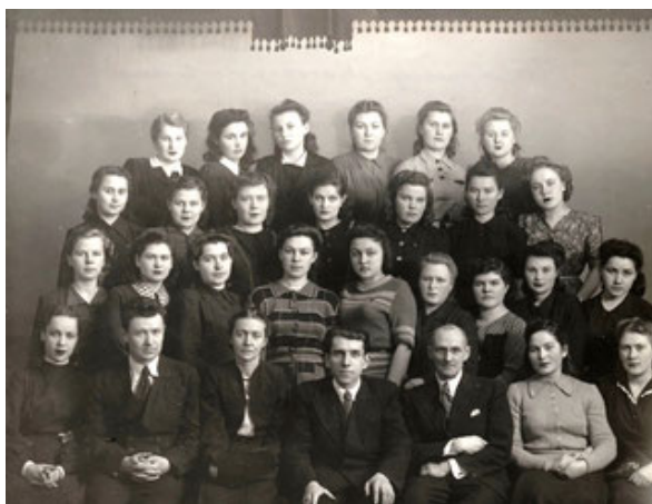
Студенты второго курса исторического факультета Свердловского педагогического института.