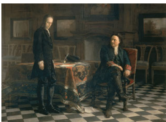
Петр I допрашивает царевича Алексея в Петергофе. Худ. Н.Н. Ге