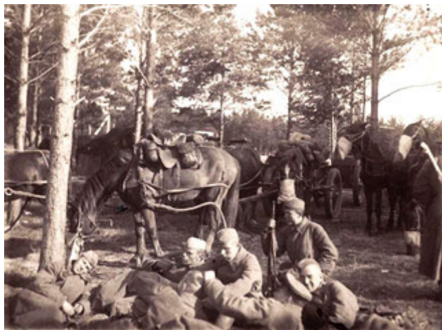
Кормление и водопой лошадей. Лагерь Камышлов, май 1941 г. ЦДООСО. Ф. 520. Оп. 1. Д. 3. Л. 179.