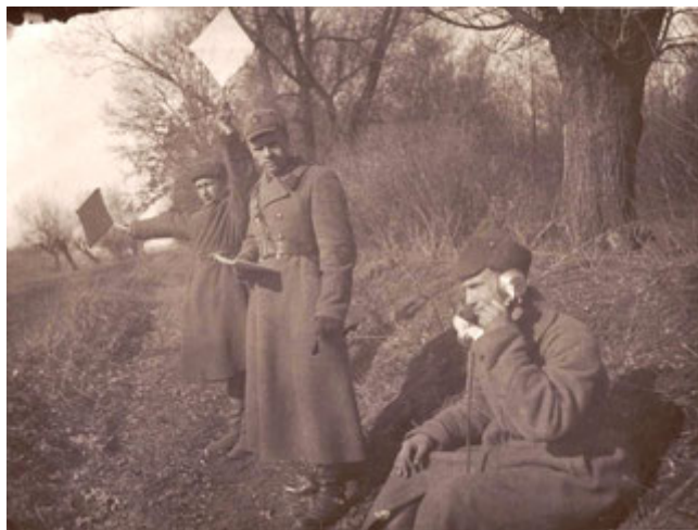
На боевой стрельбе. Передача целей для записи на огневую позицию. Лагерь Камышлов, май 1941 г. ЦДООСО. Ф. 520. Оп. 1. Д. 3. Л. 180.

С 12/IV по 14/VI-1941 года проходила боевая подготовка личного состава, призванного в части 435 полка, который потом отправился при переменной дислокации вместе со 153 дивизией в гор. Витебск, куда полк прибыл в момент вероломного нападения на СССР со стороны фашистской Германии.