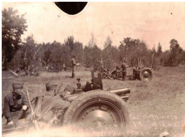
Огневой взвод на занятии, ведение огня. Лагерь Камышлов, май 1941 г.

14/VI-1941 года мы уже уехали, погрузились в Камышлове. Мы ехали с переменной дислокацией. Всю дивизию погрузили в эшелоны, через 5 минут шли эшелоны. Нас направили в Ленинград. В Волхове нас направили на юг. Я понимал, что в этот момент шли войска и для того, чтобы сбить противника с толку. Поехали на Ленинград, а потом повернули на юг и в Витебске разгрузились. Можно было прямо – гораздо ближе ехать на Москву, но мы поехали на Ленинград. Правда, сделали большое кольцо.