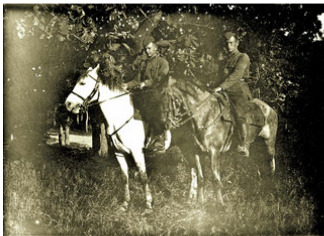
Конная разведка. Белоруссия, июль 1941 г.