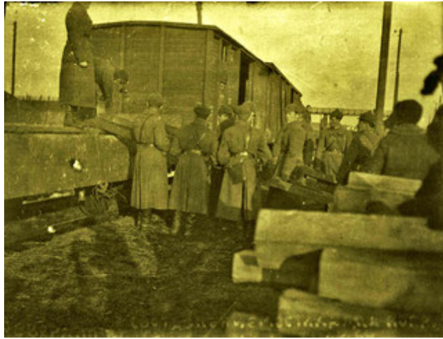
Составление эстакады для погрузки. Свердловск, май 1941 г.

С 12/IV по 14/VI-1941 года проходила боевая подготовка личного состава, призванного в части 435 полка, который потом отправился при переменной дислокации вместе со 153 дивизией в гор. Витебск, куда полк прибыл в момент вероломного нападения на СССР со стороны фашистской Германии.