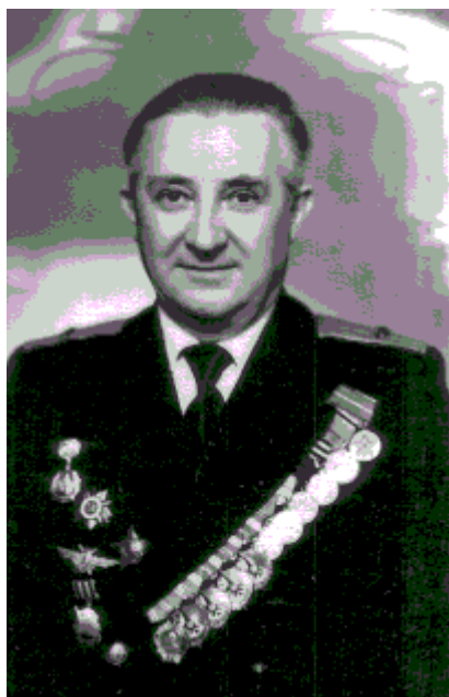
Александр Петрович Аносов, 1985 г.

г. – на Аносова, 28 апреля 1945 – на Барского) [III, л. 43–47]. Таким образом, единственное документально подтвержденное представление к званию Героя А.П. Аносова было реализовано в виде награждения его орденом Ленина.