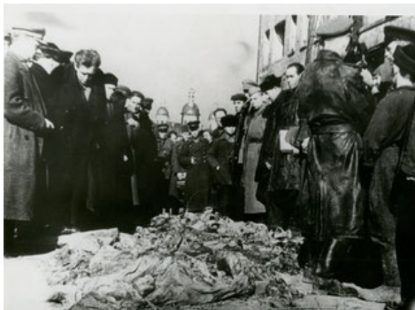
Советские воины и жители города Смоленска у могилы расстрелянных гитлеровцами советских граждан во дворе Дома Красной армии

После освобождения Смоленска 25 сентября 1943 года по указанию Чрезвычайной государственной комиссии в городе работала судебно-медицинская экспертная комиссия под руководством академика Н.Н. Бурденко. Она пришла к выводу, что «количество трупов советских граждан, умерщвленных и погибших в период временной оккупации... превышает 135 000» [VI].