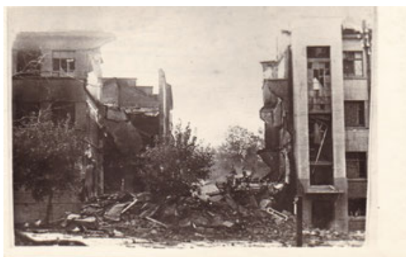
Смоленск. 13 июля 1941 г.

Война пришла в Смоленск очень быстро. После прозвучавшей по радио речи В.М. Молотова жители города не очень поверили в происходящее, полагая, что если война и началась, то будет недолгой. Но начавшиеся вскоре бомбежки города заставили людей принять горькую правду о войне. Первый налет вражеской авиации произошел ночью 25 июня – на город сбросили двухтонную бомбу. Появились первые жертвы – погибла женщина и двое ее детей. Следующей ночью бомбили городскую железнодорожную станцию, на нее сбросили более 100 бомб.