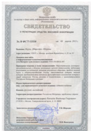
Свидетельство о регистрации

Сайт является средством массовой информации