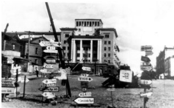
Смоленск после освобождения. Площадь Смирнова