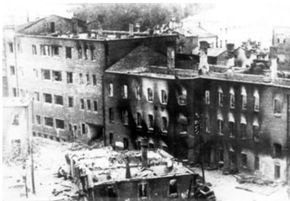
Вид Смоленска. 1942 г.

Военкоматы города проводили мобилизацию мужского населения призывного возраста в армию, из добровольцев создавались истребительные батальоны [II]. Семьи военнослужащих и работников ряда учреждений были эвакуированы. Эвакуировались фабрики, заводы, организации. Местные жители тоже покидали город, отправляясь в деревни к родственникам, где можно было выжить.