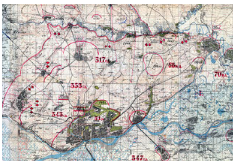
Фрагмент карты оперативного отдела штаба 56-й отдельной армии

В боевой состав 56-й отдельной армии 3-й сводный курсантский полк был введён 14 ноября. Боевые действия для него начались двумя сутками позже дневным боем за курган Бабичий. Первоначально захваченный двумя разведротами немцев у боевого охранения, курган к вечеру того же дня совместными усилиями разведывательного взвода, части сил 3-го и 2-го батальонов, при поддержке артиллерии полка и соседних дивизий был у врага отбит. Полковые потери при этом составили 5 курсантов ранеными. Противник потерял 25 человек убитыми, закопанными в ночь у хутора Кирбитово, и множество ранеными, вывезенными на машинах в тыл [XXI, л. 64об.-65].