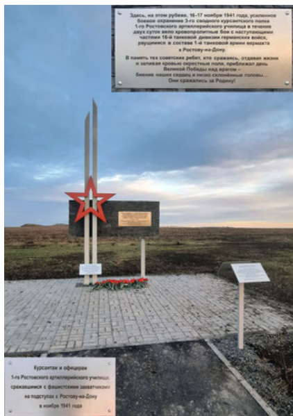
Памятник Воинской Славы курсантам и офицерам 1-го Ростовского артиллерийского училища, открытый 20 ноября 2021 года на кургане Бабичий

Ни один из выпускников Ростовского (Белгородского) артиллерийского училища и лиц его командного состава не оставил воспоминаний о своём училище. Никто из служивших и окончивших РАУ (1-е РАУ, БАУ) не пожелал сохранить в памяти поколений историю своего вуза. Исправить эту лауну приняли решение выпускники Ростовского высшего военного командно-инженерного училища Ракетных войск им. Главного маршала артиллерии М.И. Неделина [РВВКИУ РВ]. И хотя их альма-матер никогда не являлась правопреемницей РАУ, ветераны-неделинцы свято чтут память об этом ушедшем в анналы былых времён военном учебном заведении, хранят страницы его боевого прошлого и кропотливыми усилиями «своих» учёных-историков воссоздают по крупицам историю Ростовского артиллерийского училища.