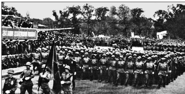
Парад Победы над Японией в освобожденном Харбине 16 сентября 1945 г.