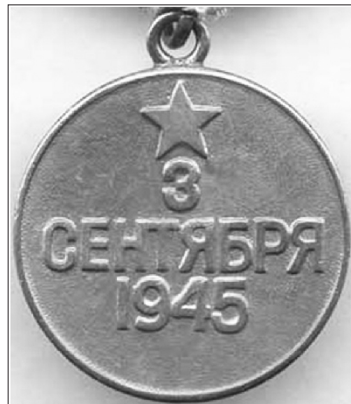
Реверс медали «За Победу над Японией»