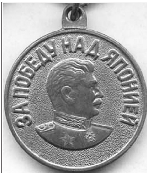
Аверс медали «За Победу над Японией»