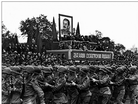
Фото с парада в Харбине в честь Победы над Японией. 16 сентября 1945 г. Командовал парадом командующий артиллерией 1-ой Краснознаменной Армии 1-го ДВФ генерал-лейтенант К. П. Казаков . Принимал парад командующий 1-ой Краснознаменной Армии 1-го ДВФ генерал-полковник А. П. Белобородов