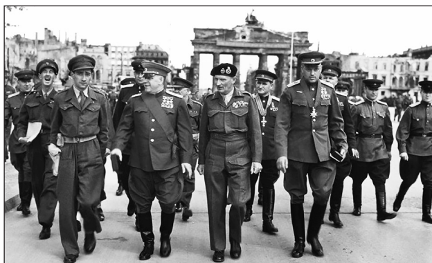
Парад Победы во Второй мировой войне. Берлин, 7 сентября 1945 г. В центре маршал Г. К. Жуков с союзниками.