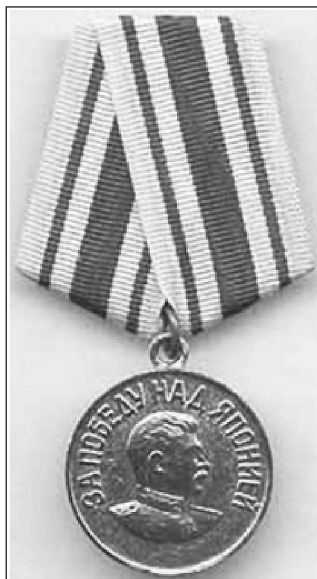
Внешний вид медали «За Победу над Японией»