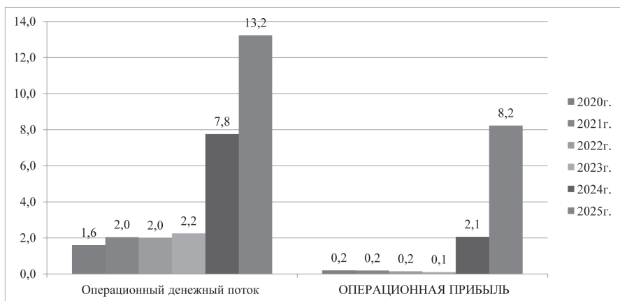
Рис. 2. Динамика денежного потока и чистой прибыли завода при переходе на ценообразование серийных ГОЗ методом сравнимой цены 117

Можно сделать вывод, что обязательное применение при определении цен на серийную продукцию по ГОЗ методом сравнимой цены в соответствии со статьей 10 Федерального закона от 29 декабря 2012 г. № 275-ФЗ «О государственном оборонном заказе» создает экономические условия и мотивирует предприятия ОПК осуществлять финансирование инвестиционных проектов технологического развития, диверсификации, импортозамещения и роста поставок на экспорт за счет собственной прибыли без привлечения средств из федерального бюджета и других государственных источников.