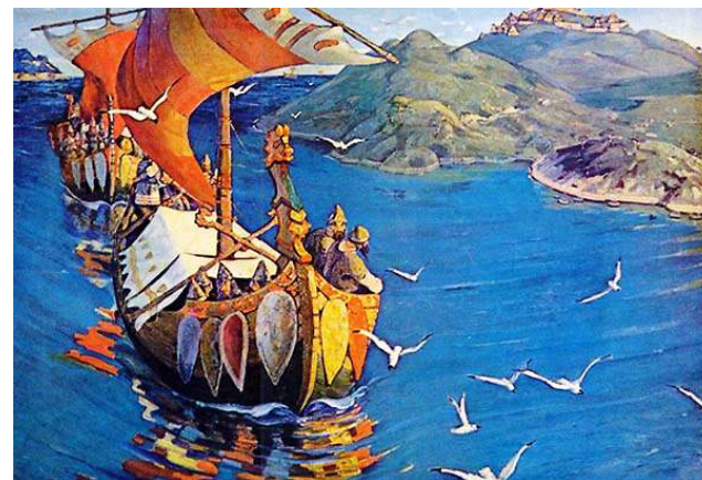
«Заморские гости» (Н. Рерих, 1901 г.)

После смерти варяга Рюрика носителем политических, сакральных и военных функций нового режима стал опекун малолетнего князя Игоря и герой многих былин и преданий Олег Вещий (древнегерм. Helgi – «священный»). При нем формируется межплеменное войско Северной Руси и совершаются походы на Киев, а затем и далее – на Царьград (Константинополь). Дата захвата Олегом Киева в 882 г., в ходе которого был вероломно убит местный князь Аскольд, также варяг, но уже христианин, и считается годом образования единого Древнерусского государства. Что касается скандинавов, осевших на пространствах Руси, то они постепенно растворились в этно-культурном котле генерирующей русской государственности. Масса домыслов и околонучных интерпретаций данных фактов породила такие концепции, как норманизм (теория о исключительной роли норманнов в образовании Древней Руси) и антинорманизм (полное отрицание всякого участия норманнов в процессе древнерусской истории). При всей сложности отделения мифа от реальности, современная наука одинаково отвергает теории и норманизма, и антинорманизма. Роль