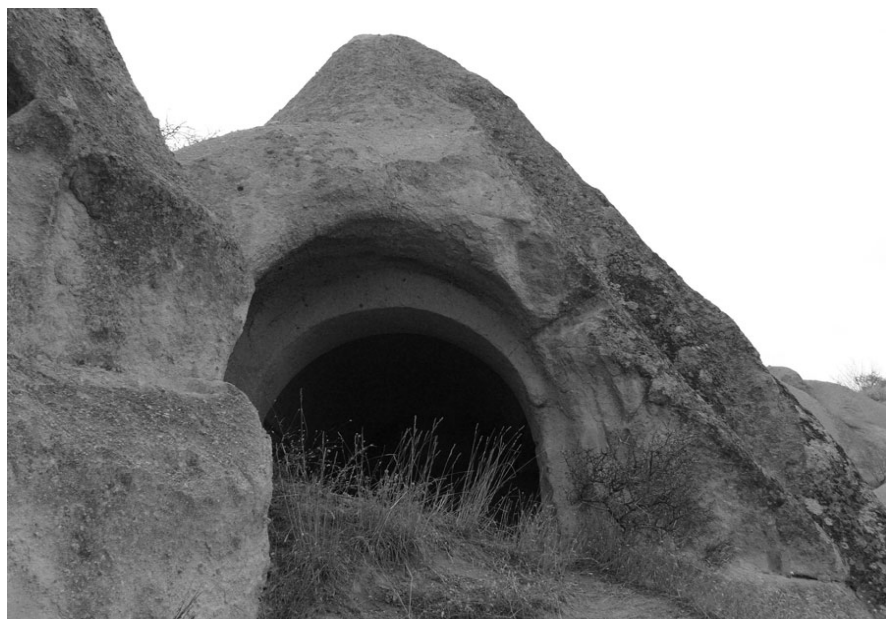
Рис. 2. Христианский храм близ селения Гореме. GPS. N 38° 38' 50.0" E 034° 49' 25.2"