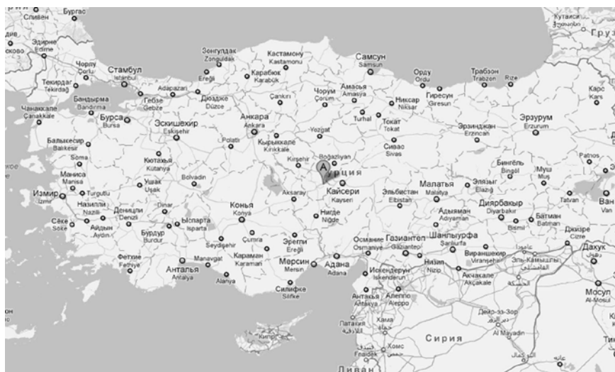
Рис. 1. Селение Гореме. Центральная Анатолия. Турция