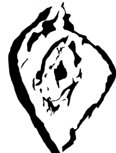
Рис. 5. Мандорла