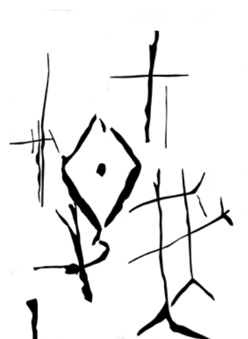
Рис. 4. Ромб с точкой в центре. Знак, аналогичный знаку в палеолитической композиции на обломке рога из грота Лортэ.